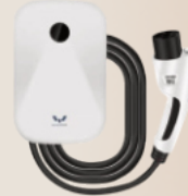
Gratis 7 kW GBT Home Charger

Nikmati kenyamanan pengisian daya di rumah dengan melakukan instalasi home charging non-OCPP 7kW dan dapatkan juga pilihan tambah daya hingga 11kW atau pasang meteran baru dengan 7.7kW secara gratis (dengan catatan: Kabel 5 Meter, Saluran listrik atas, 1 Phasa)