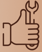
Gratis Pemasangan Home Charger

Ketika Anda menerima panggilan dari nomor di bawah ini disarankan agar Anda menjawabnya tepat waktu. Jika tidak, maka dapat mempengaruhi layanan pemasangan pengisian daya Anda.