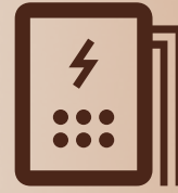
Gratis Pemasangan Baru atau Tambah Daya